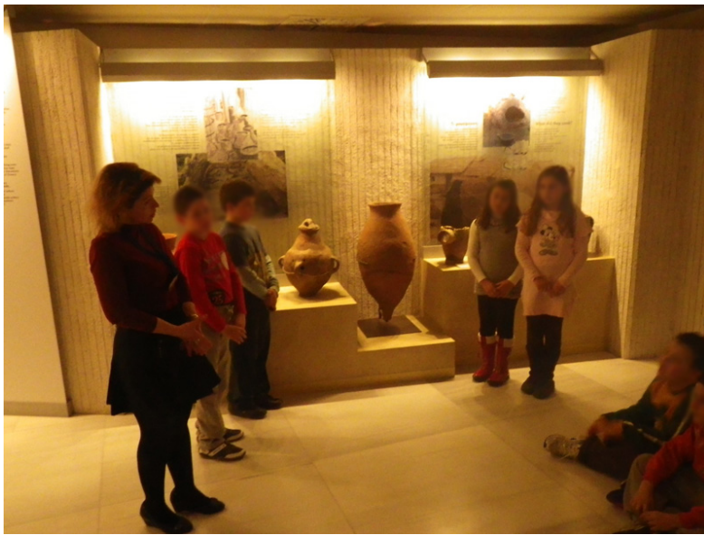
Εικόνα 1. Επίσκεψη στο Αρχαιολογικό Μουσείο Θεσσαλονίκης.