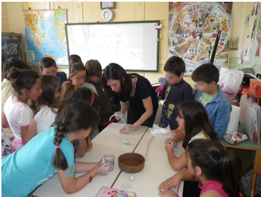
Εικόνα 3. Κατασκευή πήλινων αντικειμένων στην τάξη με τη βοήθεια της δασκάλας των εικαστικών