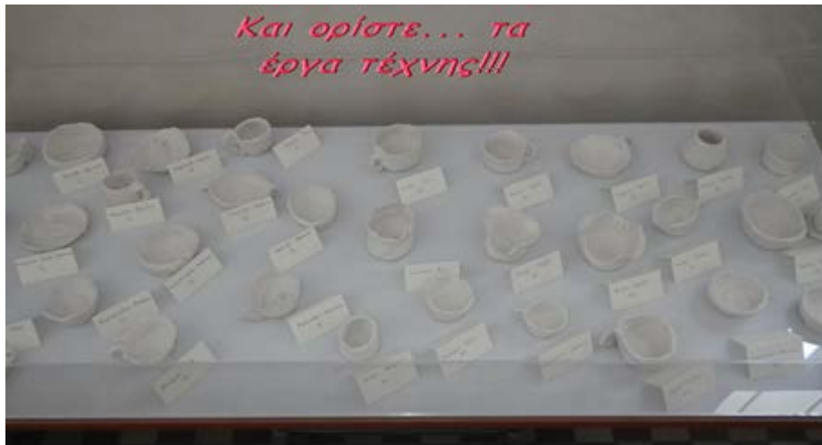
Εικόνα 5. Τα έργα τέχνης των μαθητών