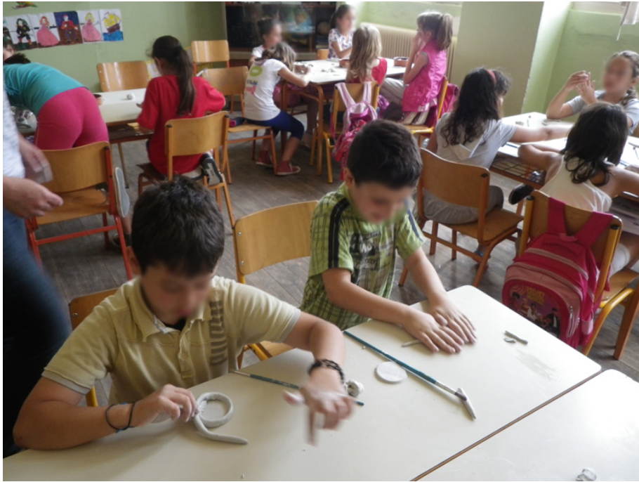
Εικόνα 4. Κατασκευή πηλινων αντικειμένων στην τάξη